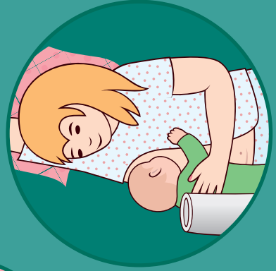
படுத்த நிலையில் பாலூட்டுதல்