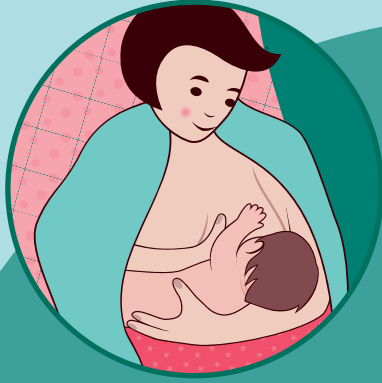
மார்புக்கு குறுக்காக தராசு போன்ற நிலையில்