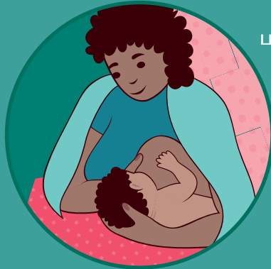
பக்கமாகச் சரிந்துபடுத்த நிலையில்