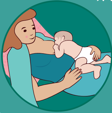
சரிந்து இருக்கும் நிலையில்