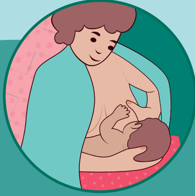
மார்புக்கு குறுக்காக தராசு போன்ற பக்கவாட்டு நிலையில்